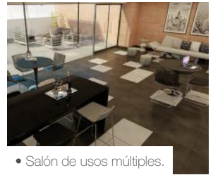
• Salón de usos múltiples.