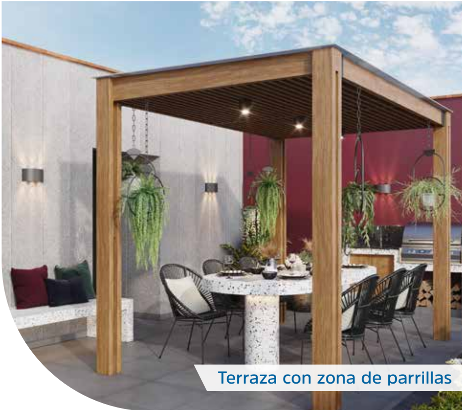
Terraza con zona de parrillas