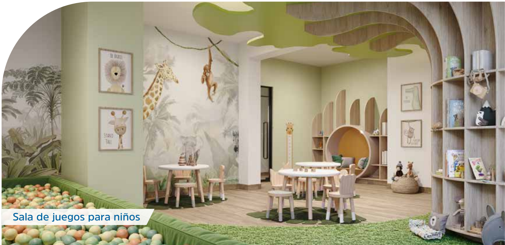
Sala de juegos para niños