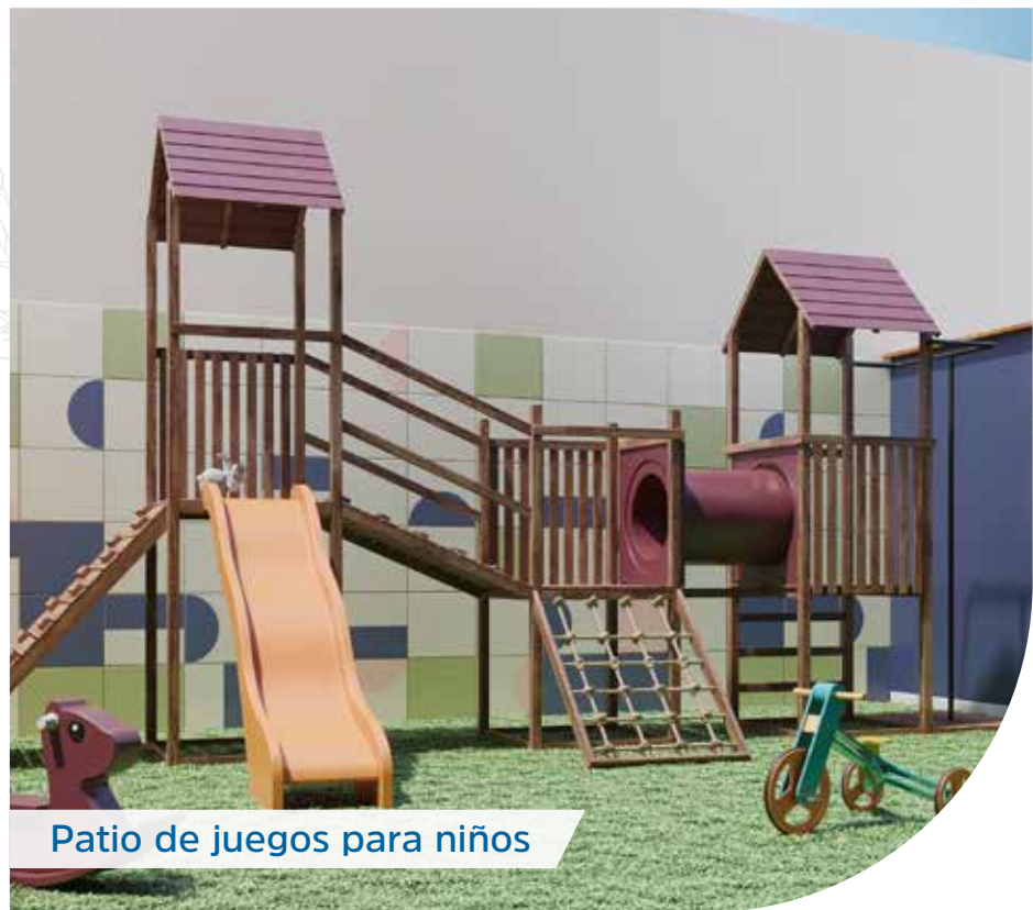
Patio de juegos para niños