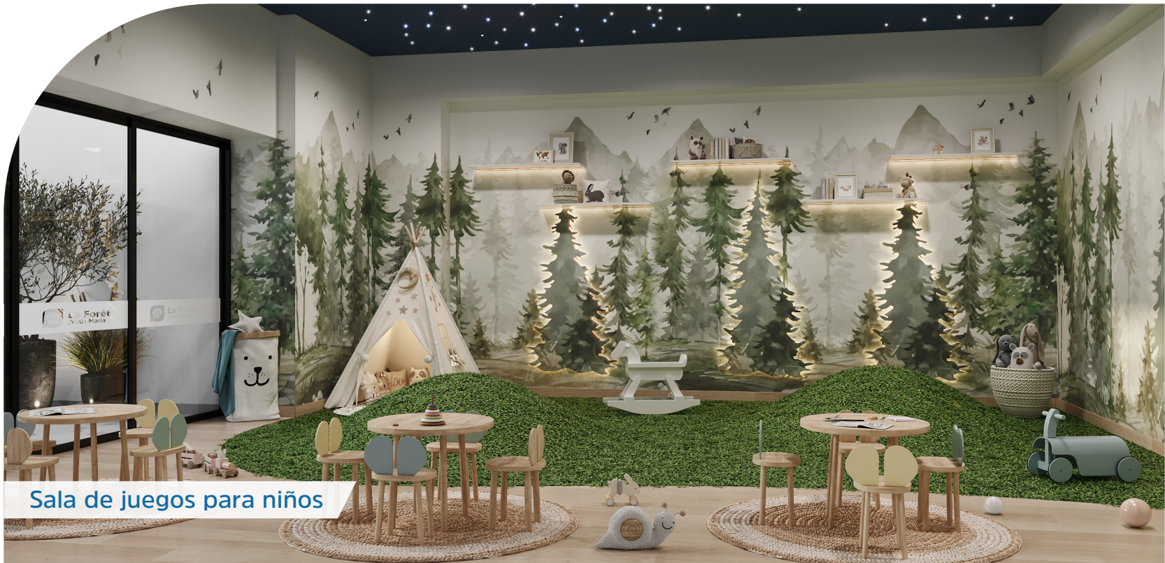
Sala de juegos para niños