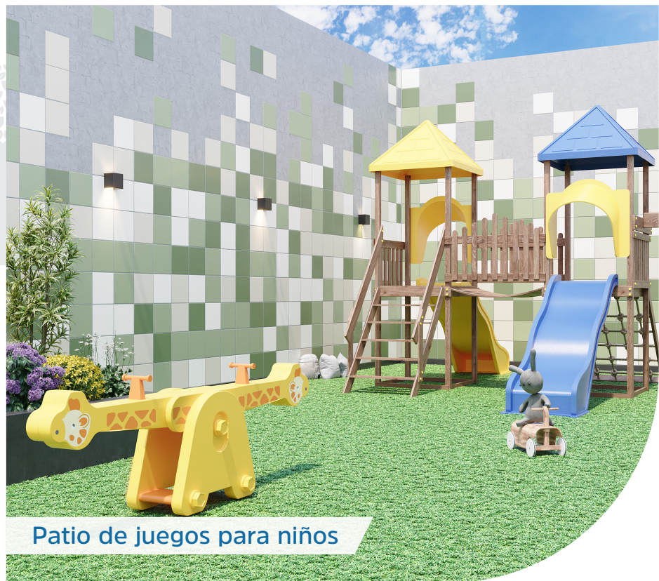
Patio de juegos para niños