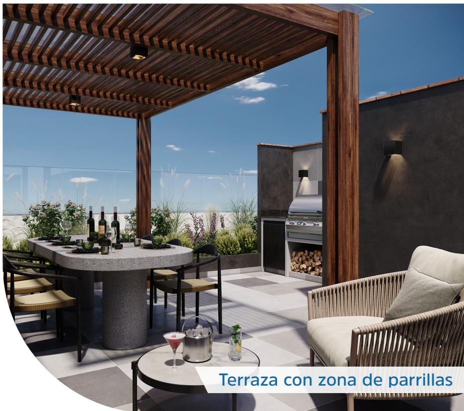
Terraza con zona de parrillas