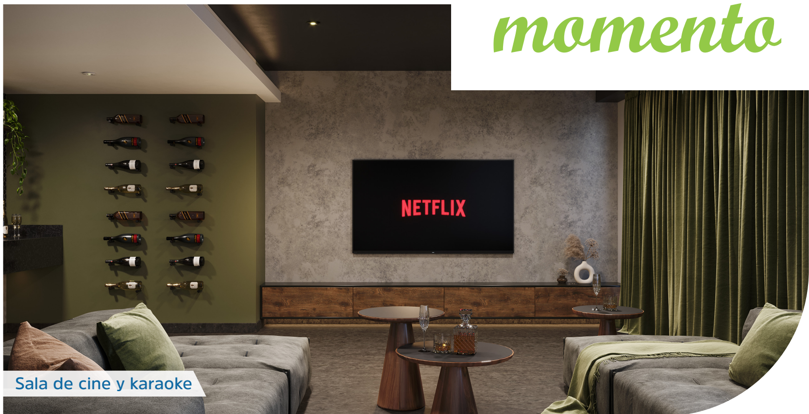
Sala de cine y karaoke