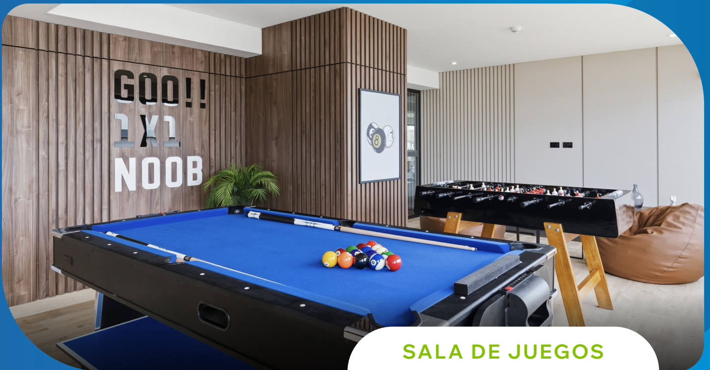
SALA DE JUEGOS