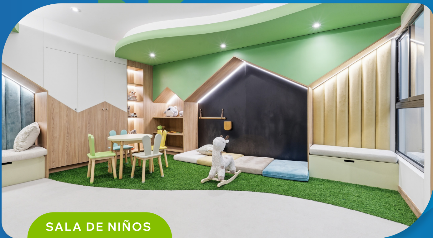
SALA DE NIÑOS