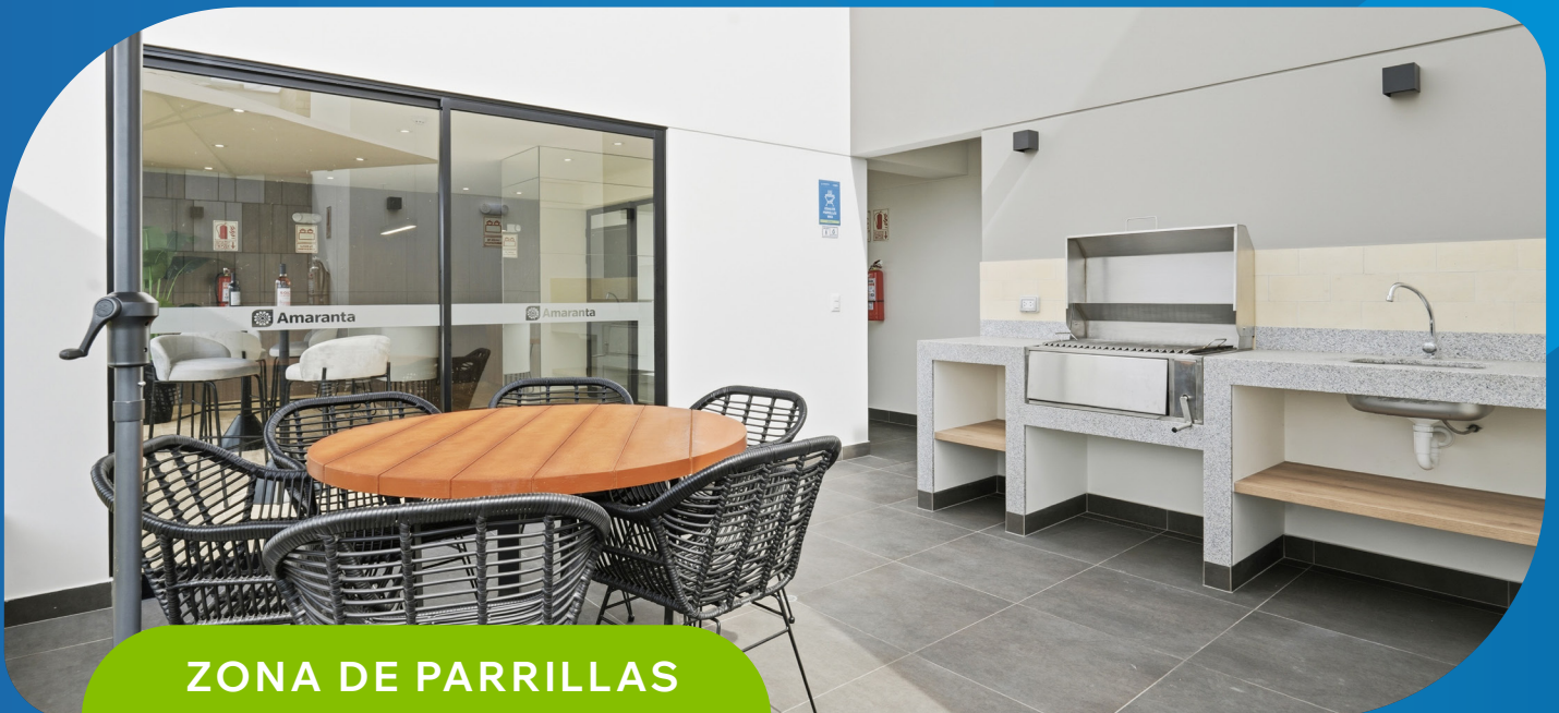
ZONA DE PARRILLAS