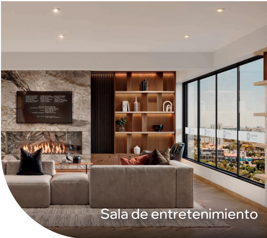
Sala de entretenimiento