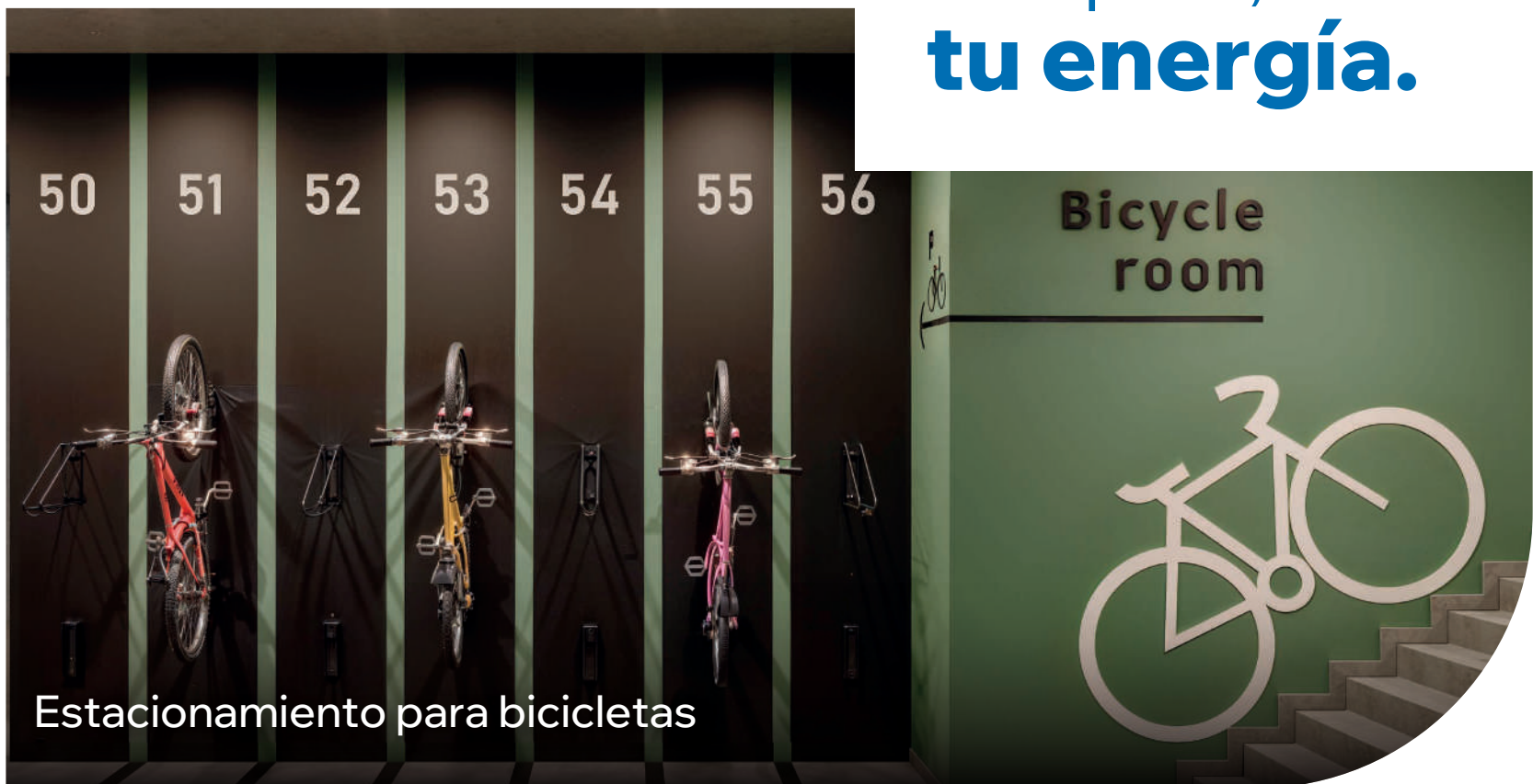
Estacionamiento para bicicletas