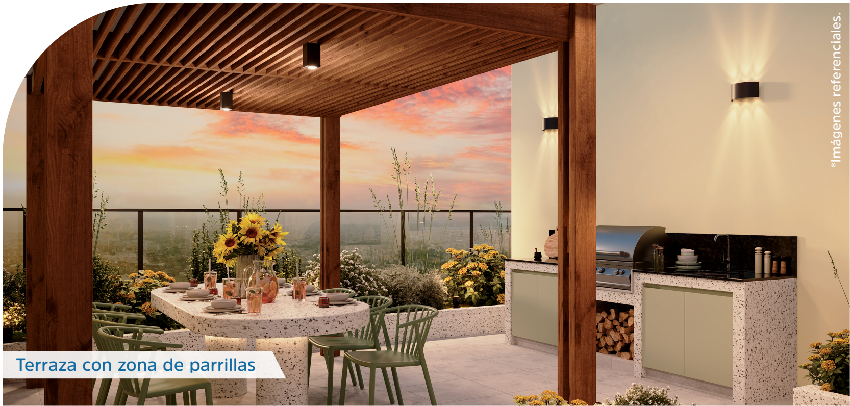
Terraza con zona de parrillas