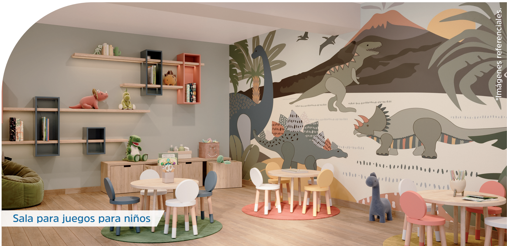
Sala para juegos para niños