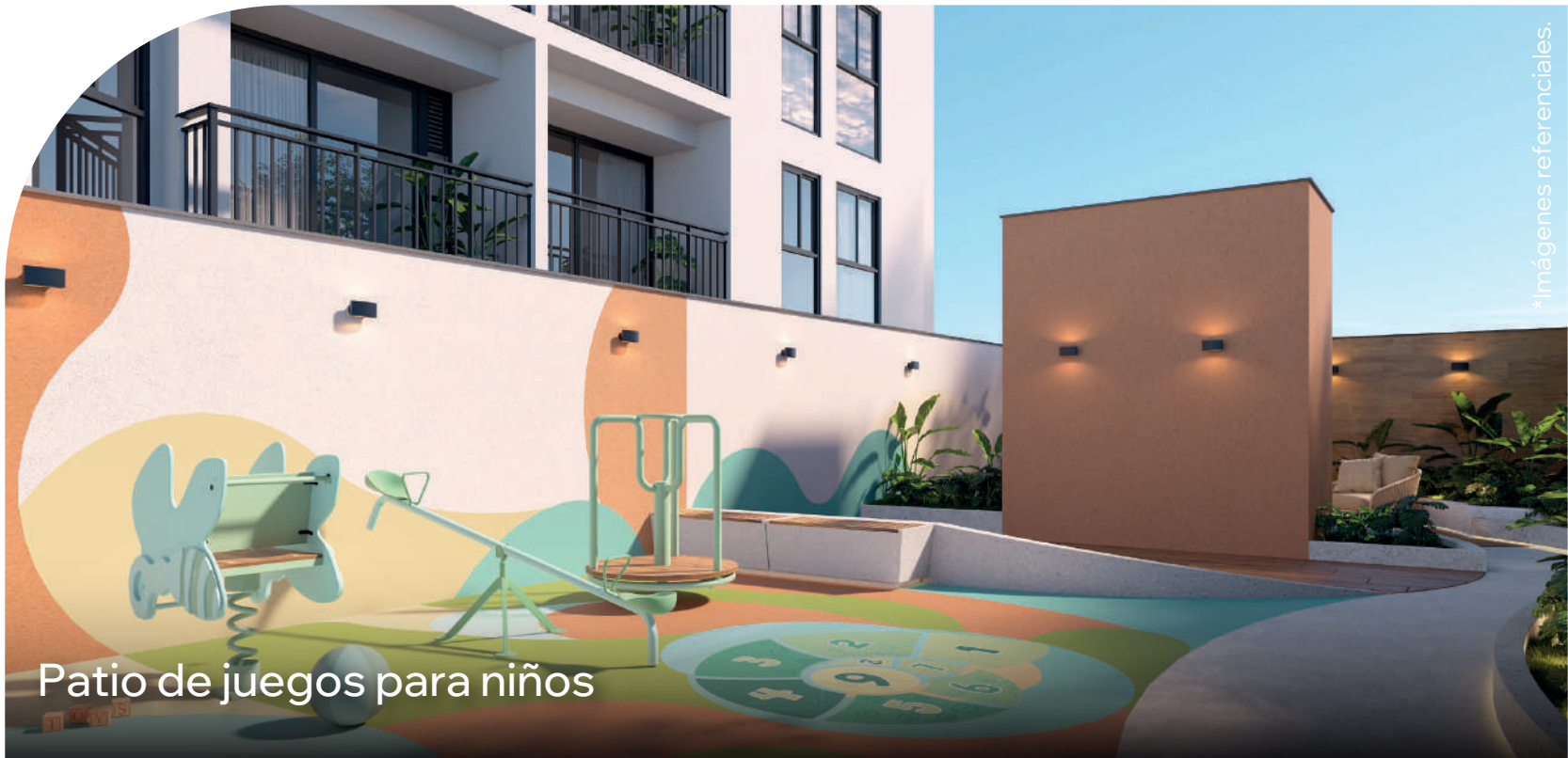
Patio de juegos para niños