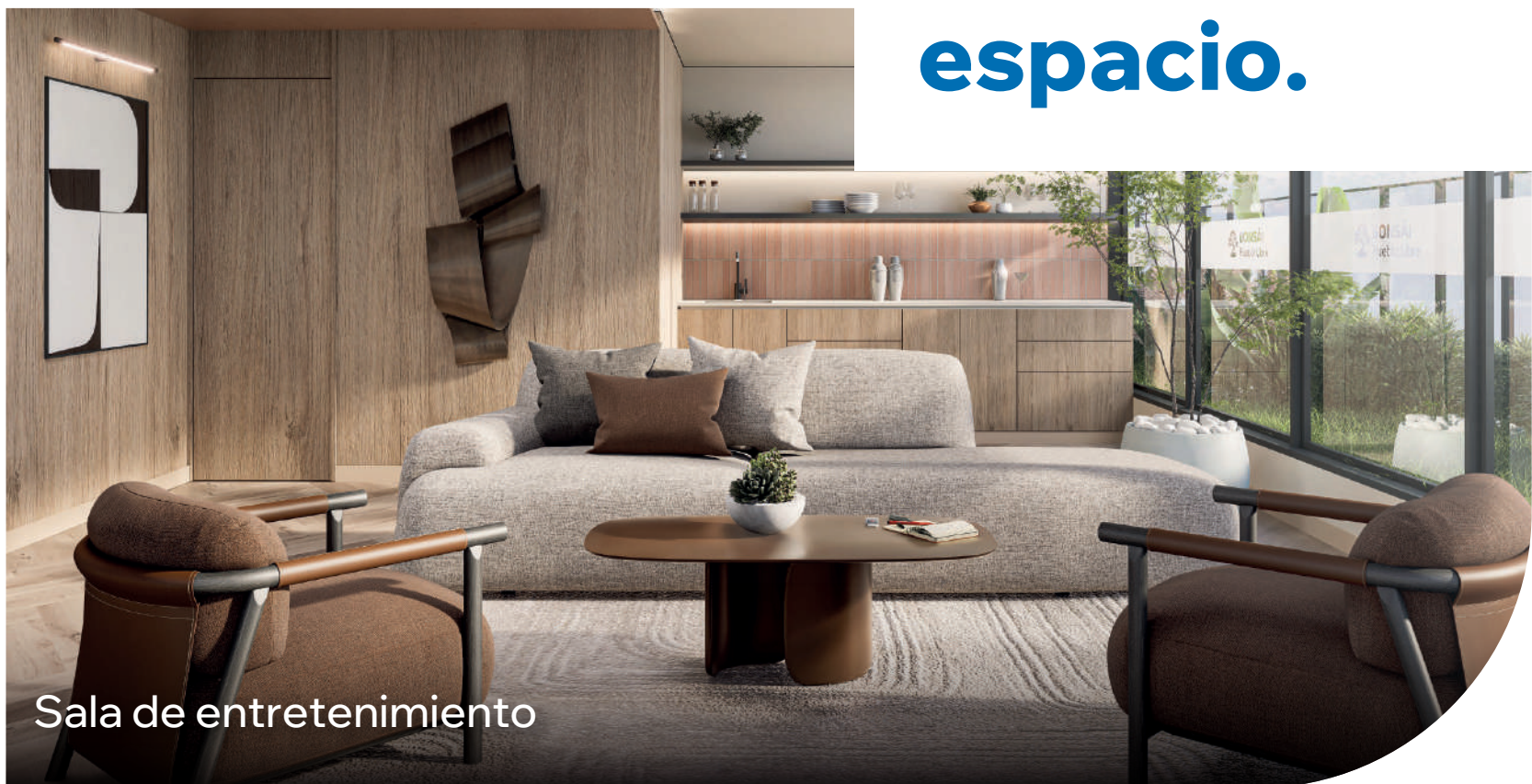
Sala de entretenimiento