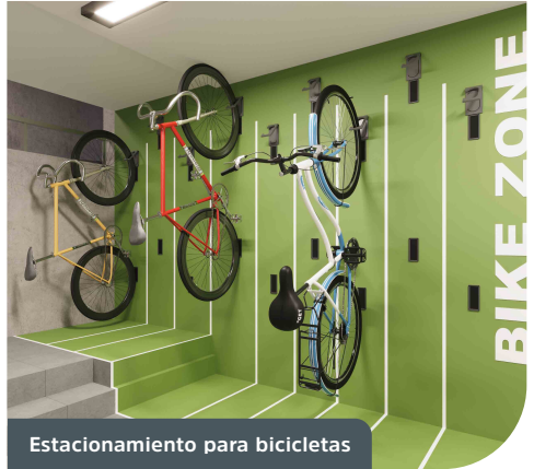
Estacionamiento para bicicletas